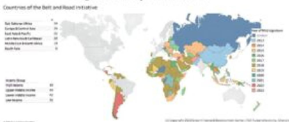
Figura 1 - Países que aderiram à ICR

No texto, a ICR, proposta pelo presidente Xi Jinping em 2013, é apresentada como “uma plataforma para a construção de uma comunidade global de futuro compartilhado”. Nesse sentido se busca enfatizar um caráter mutuamente benéfico dos projetos da iniciativa, que seriam “propostos pela China, mas pertencentes a todo o mundo”.