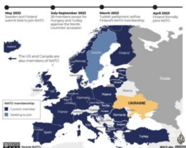
Figura 1 – Países da OTAN.

Criada em 1949, no ambiente marcado pela bipolaridade do sistema internacional entre EUA e União Soviética, no pós 2ª Guerra Mundial e início da Guerra Fria, a OTAN se conformou como um arranjo de defesa coletiva, por intermédio do qual os Estados-membros concordam em atuar conjuntamente, em apoio mútuo, caso qualquer um dos países da aliança seja atacado.