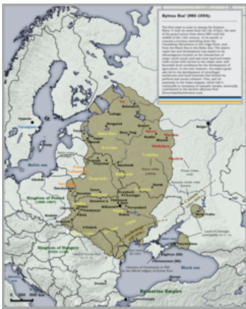
Figura 1 – Principado de Kiev

O primeiro grande império do leste europeu foi o Principado de Kiev, atual capital da Ucrânia, surgido no século IX. Sua população era constituída por uma mistura de Vikings escandinavos, que chegavam do Norte pelos rios, e pelos eslavos orientais, nativos da própria região. A pobreza do solo logo obrigou essas populações a buscarem novas terras, expandindo o território e delineando um império. Como explica Robert Kaplan, em A Vingança da Geografia, a Rússia, como conceito geográfico e cultural nasceu do Principado de Kiev.