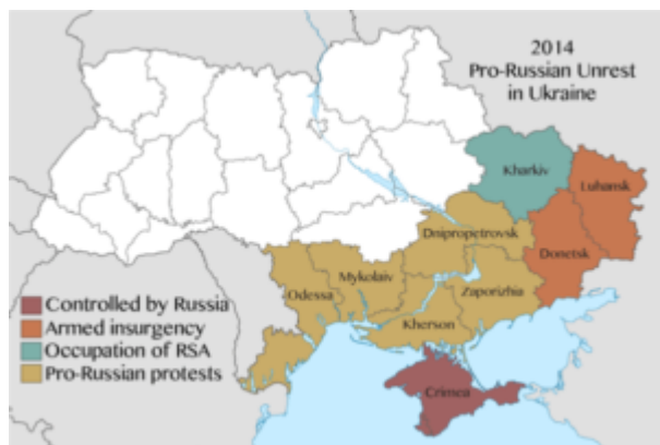
Figura 3 – Regiões da Ucrânia oriental. Note-se, no centro do país, cortando-o de norte a sul, o Rio Dnieper

Em abril, grupos pró-Rússia na região de Donbas, no leste da Ucrânia, iniciaram uma guerra civil. Embora a Rússia não reconheça, é fato hoje incontestável que o país apoiou militarmente os separatistas, em uma ação típica de Guerra Híbrida, com soldados e equipamentos, mas também com Operações de Informação e Cibernéticas, o que impediu a Ucrânia de controlar a situação. Diversos países do ocidente impuseram sanções econômicas à Rússia em razão dessa interferência.