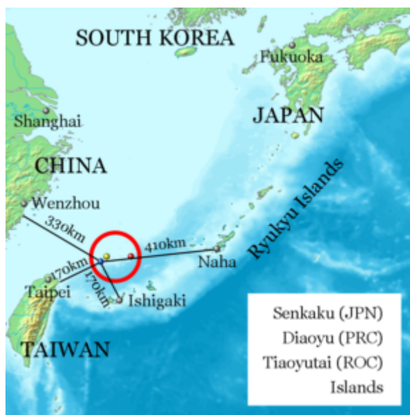
Figura 4 – Ilhas Senkaku/Dyaoyu

navio de guerra chinês marcou a laser um navio da Marinha das Filipinas, ou outro, em que um navio de pesquisa chinês entrou ilegalmente na zona econômica exclusiva marítima da Malásia e perseguiu um navio contratado de uma empresa estatal de petróleo daquele país. Há também casos em que navios da Guarda Costeira chinesa assediaram navios de pesca japoneses nas Ilhas Diaoyu/Senkaku, disputadas entre os dois países (e também pelos taiwaneses, que as denominam Tiaoyutai).