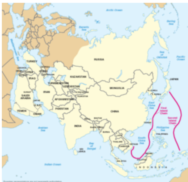
Figura 2 – Duas cadeias de ilhas

A China tem sua saída para o Oceano Pacífico contida por duas cadeias de ilhas.