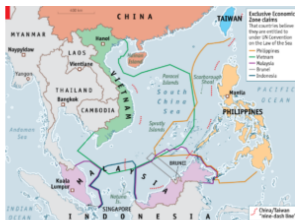
Figura 3 – Mar do Sul da China

Apoiada nesse poderio militar, a China vem estabelecendo instalações de comunicações, campos de pouso e portos, posições fixas de armas e guarnições militares nas Ilhas Spratly, no Mar do sul da China, desde 2018.